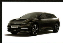
Aurora Black Pearl