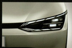
Projecteurs avant Full LED matriciels avec gestion intelligente des deux feux de route.