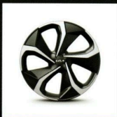
Jante alliage 20" Noir laqué