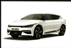
Snow White Pearl