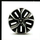
Jante alliage 19" Gris anthracite